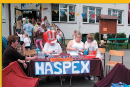
Polska Biega Marcówka