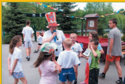
Polska Biega Marcówka