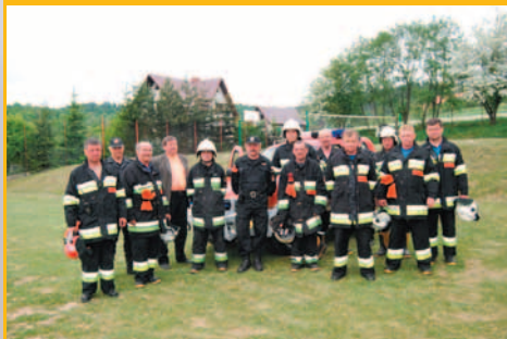
Ćwiczenia OSP w Śleszowicach