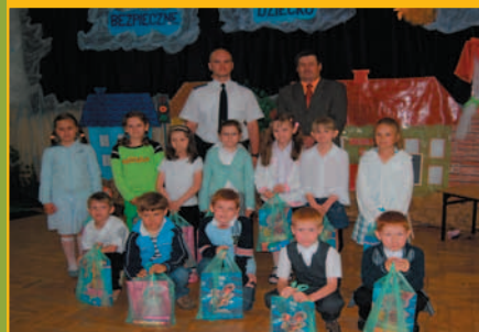
Konkurs – Bezpieczna 7 w Śleszowicach