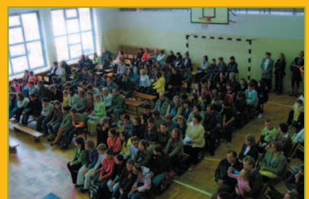
Dzień Rodziny w Tarnawie Dolnej