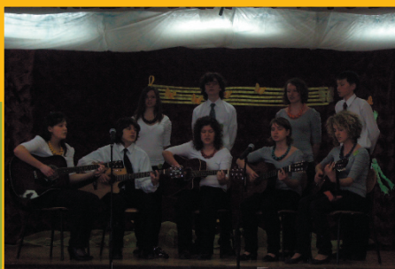
Konkurs – Talenty Wesołe Struny