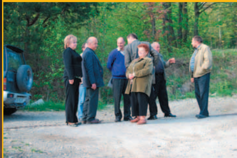
Komisja Rozwoju Gospod. w terenie