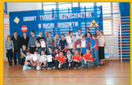
Gminny Turniej BRD