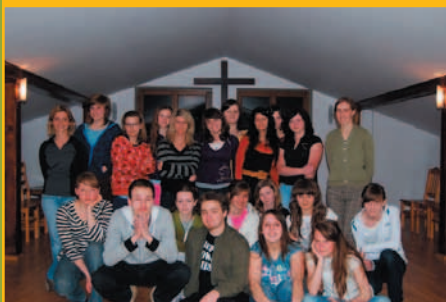
Warsztaty wokalne grupa