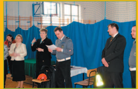
Gminny Turniej BRD