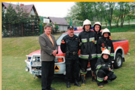
Ćwiczenia OSP w Śleszowicach