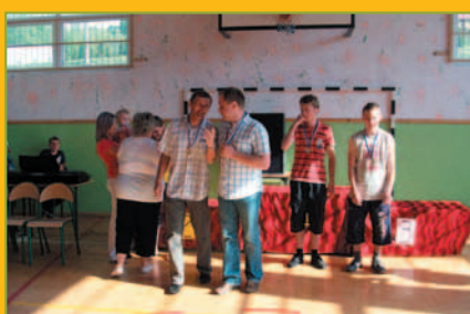
Polska Biega Marcówka