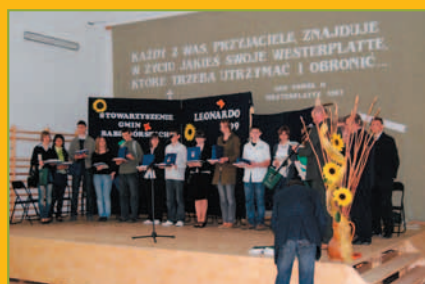
Leonardo w ramach Stowarzyszenia Gmin