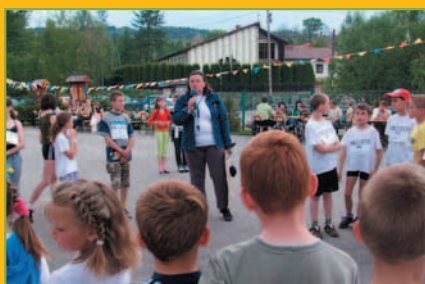
Polska Biega Marcówka