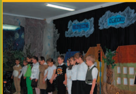
Konkurs – Bezpieczna 7 w Śleszowicach