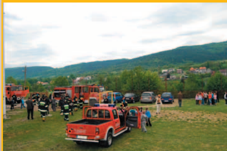
Ćwiczenia OSP w Śleszowicach