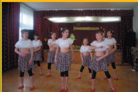
Konkurs – Talenty - dk 2 Marcwka