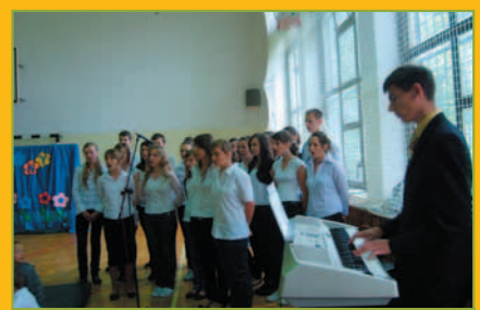
Dzień Rodziny w Tarnawie Dolnej