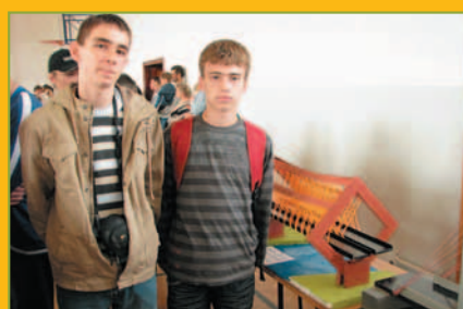
Makiety mostów - autorzy prac