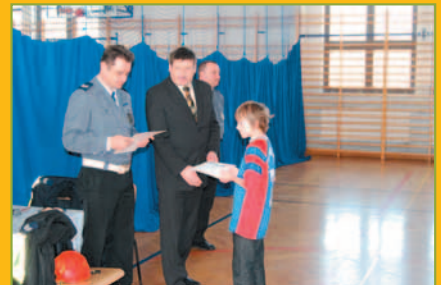
Gminny Turniej BRD