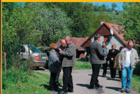
Komisja Rozwoju Gospod. w terenie