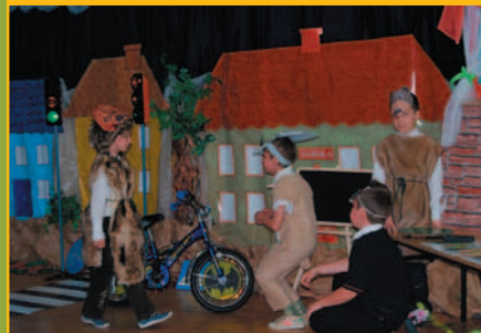
Konkurs – Bezpieczna 7 w Śleszowicach