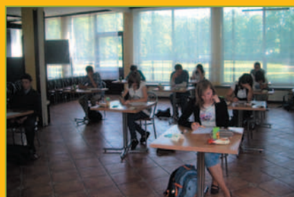
Leonardo - Gminny konkurs