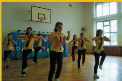
Dzień Rodziny w Tarnawie Dolnej