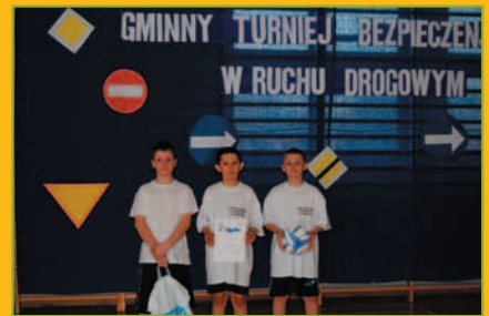
Gminny Turniej BRD