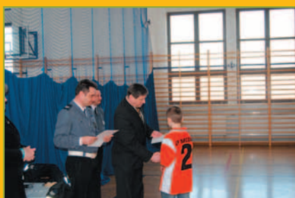
Gminny Turniej BRD