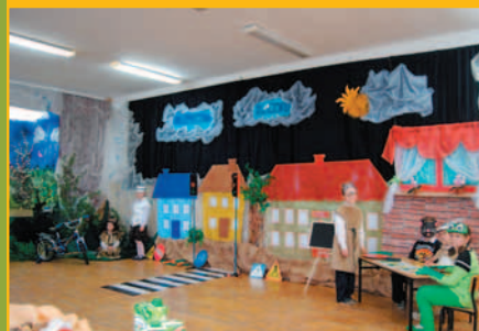
Konkurs – Bezpieczna 7 w Śleszowicach