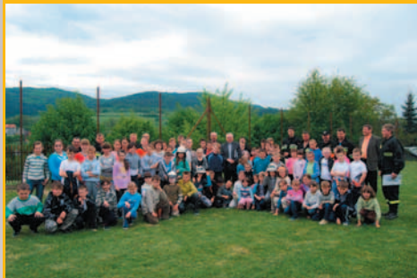
Ćwiczenia OSP w Śleszowicach