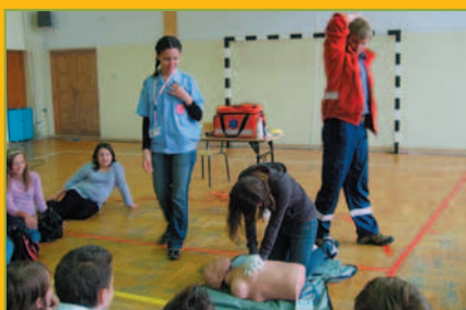
Dzień Rodziny w Tarnawie Dolnej