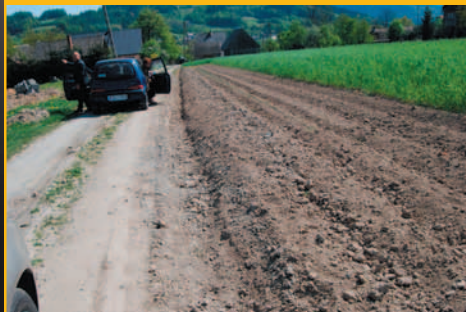
Komisja Rozwoju Gospod. w terenie