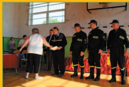
Polska Biega Marcówka