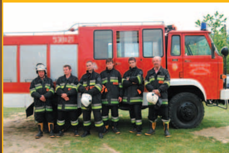
Ćwiczenia OSP w Śleszowicach