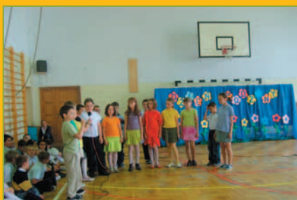
Dzień Rodziny w Tarnawie Dolnej