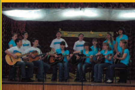
Konkurs – Talenty Mirameja