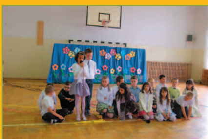
Dzień Rodziny w Tarnawie Dolnej