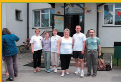
Polska Biega Marcówka