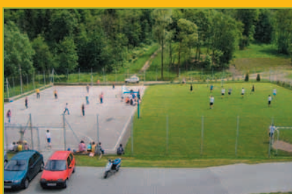
Dzień Rodziny w Tarnawie Dolnej