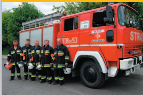
Ćwiczenia OSP w Śleszowicach