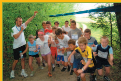
Polska Biega Marcówka