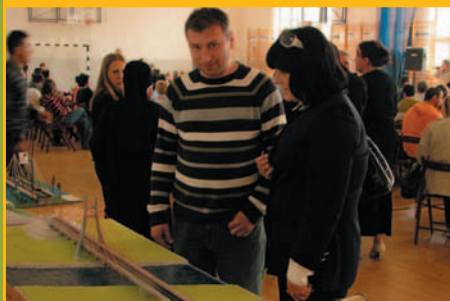
Makiety mostów- jurorzy