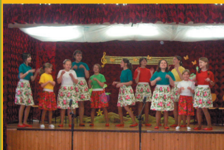
Konkurs – Talenty - Jagódki Marcówka