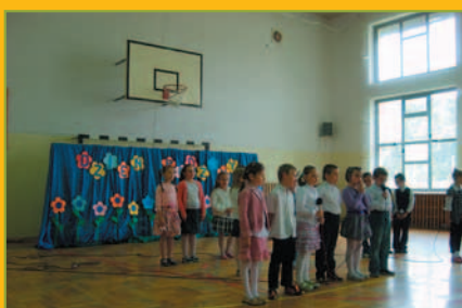
Dzień Rodziny w Tarnawie Dolnej