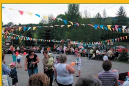
Polska Biega Marcówka