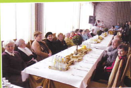
Jubileusze i oplatek w Zembrzycach