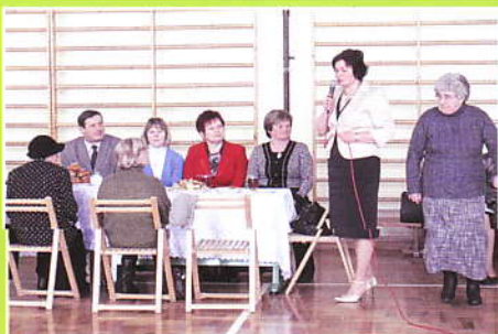
Dzień Babci w Tamawie Dolnej