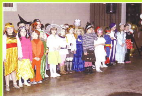
Bal Karnawałowy dzieci z terenu Gminy Z-ce