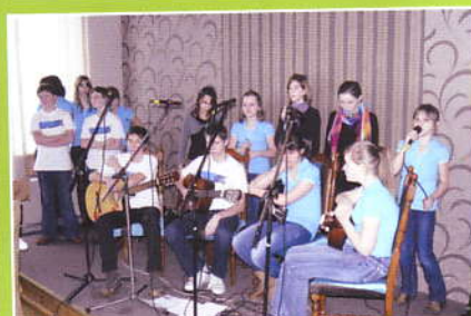
Występ młodzieży z ZS w Zembrzycach