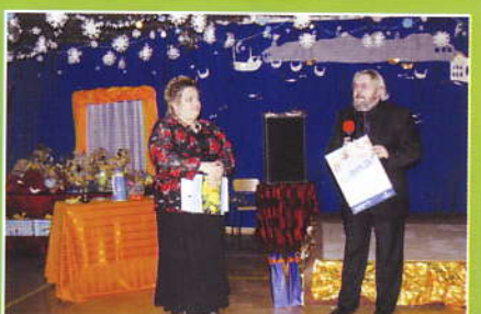
Wręczenie nagrody przez przedstw. Banku