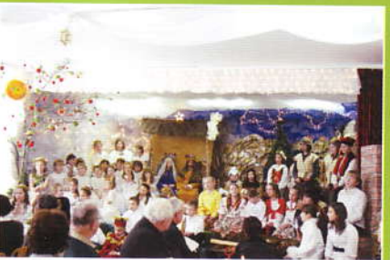
Jaselka i opłatek w Śleszowicach