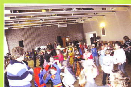
Bal Karnawałowy dzieci z terenu Gminy Z-ce