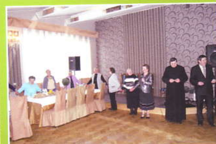
Życzenia i modlitwa ks. Proboszcza