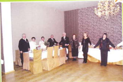
W czasie życzeń noworocznych - goście