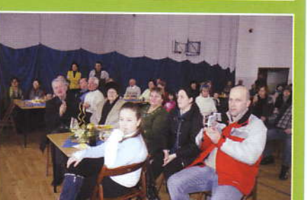
Dzień Babci i Dziadka w Szkole w Zembrzycach