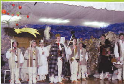
Babiogórskie Podlasy w Śleszowicach