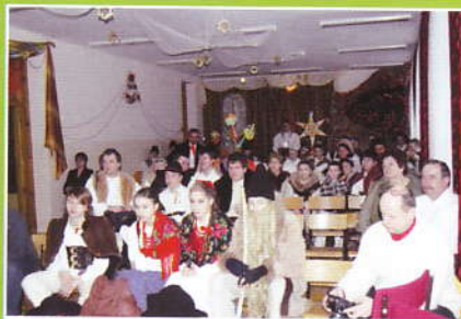
Babiogórskie Podlasy w Śleszowicach