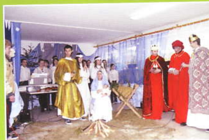
Oplatek w Zespole Szkół w Tarnawie Dolnej