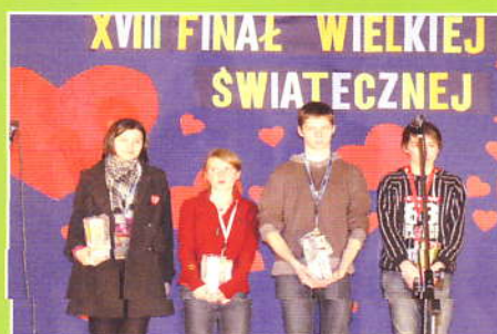
Final Orkiestry w Zembrzycach - Wolontariusze