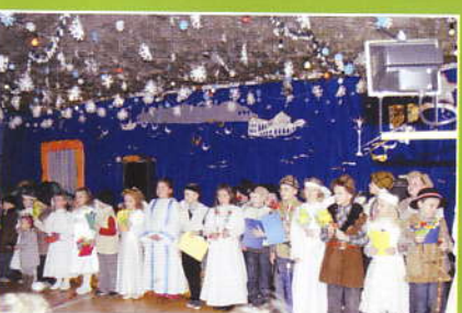
Dzieci w Marcówce dla Babcie i Dziadka