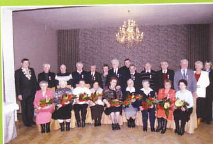
Zdjęcie zbiorowe jubilatów i władz Gminy