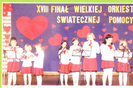
Final W. Orkiestry w Zembrzycach-Wykonawcy