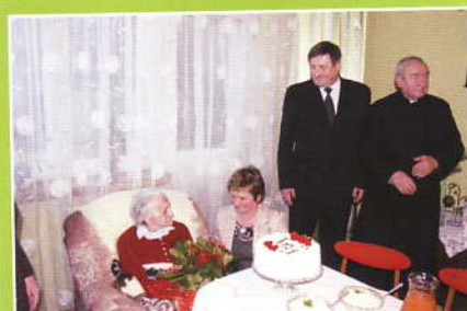
Życzenie od Wójty i Sekretarza Gminy