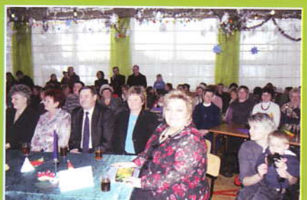
Widzowie i goście na jasełkach