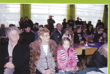
Goście na występach w Marcówce