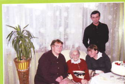
Stulatka z opiekunami