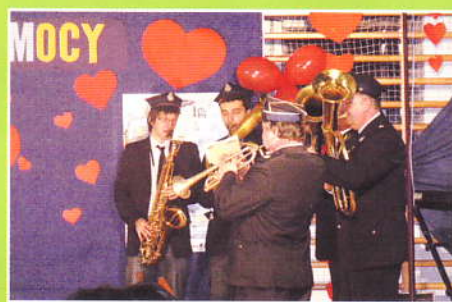
Final W. Orkiestry w Zembrzycach-Orkiestra Rytm