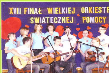
Final W. Ork. w Zembrzycach - Wesole Struny