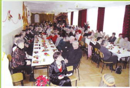
Jaselka i opłatek w Śleszowicach