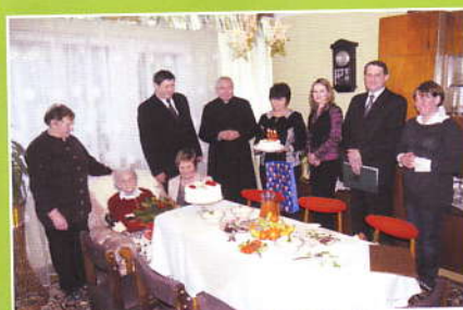
Pamiątkowe zdjęcie Gości i Opiekunów