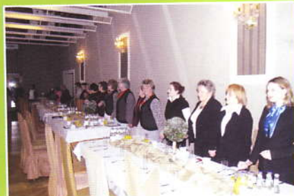
W czasie życzeń noworocznych - goście