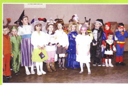
Bal Karnawałowy dzieci z terenu Gminy Z-ce