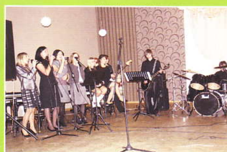
Koncert Pamięci Niemena w Zembrzycach