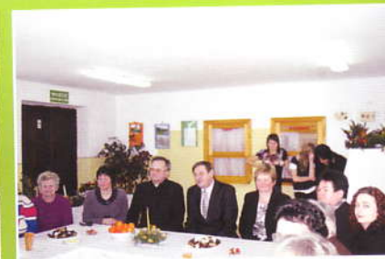
Oplatek w Zespole Szkół w Tarnawie Dolnej