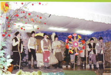
Babiogórskie Podlasy w Śleszowicach