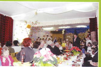
Jaselka i opłatek w Śleszowicach