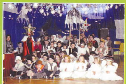
Jaselka w Marcówce