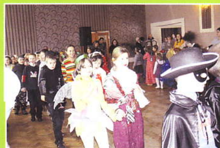
Bal Karnawałowy dzieci z terenu Gminy Z-ce