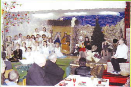
Jaselka i opłatek w Śleszowicach