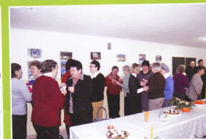
Oplatek w Zespole Szkół w Tarnawie Dolnej