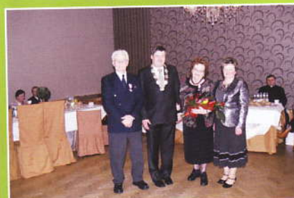
Zdjęcie pamiątkowe jubilatów diamentowych