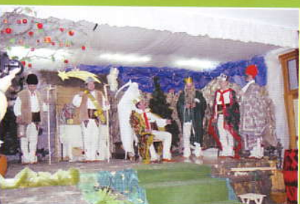
Babiogórskie Podlasy w Śleszowicach