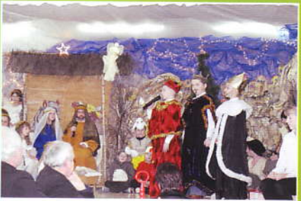
Jaselka i opłatek w Śleszowicach