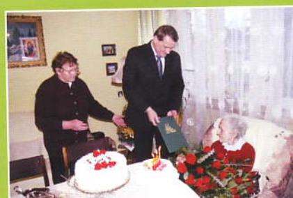
Życzenia od Kierownika KRUS