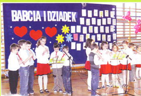
Dzień Babci i Dziadka w Szkole w Zembrzycach