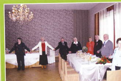
W czasie życzeń noworocznych - goście