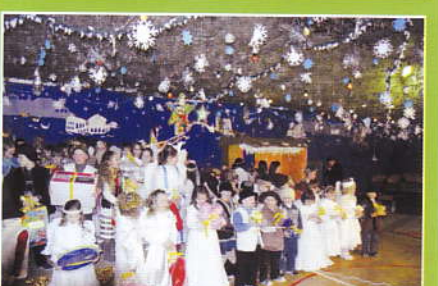
Obdarowane dzieci prezentami