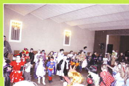
Bal Karnawałowy dzieci z terenu Gminy Z-ce