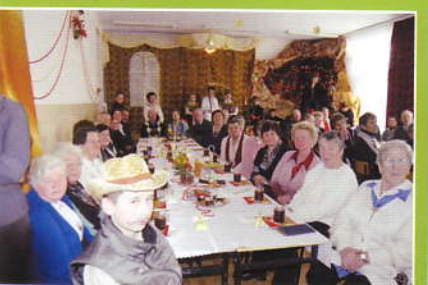
Jaselka i opłatek w Śleszowicach