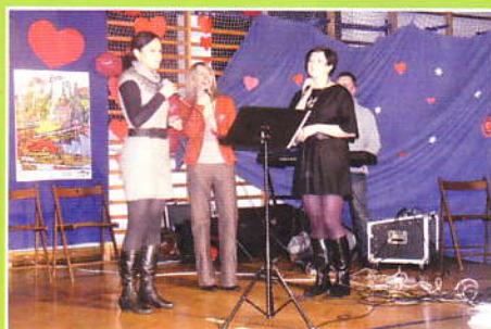
Final W. Orkiestry w Zembrzycach-Wykonawcy