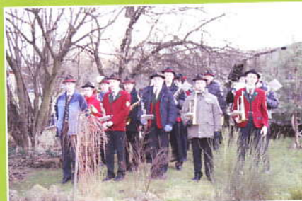
Koncert Orkiestry Śleszowice dla Jubilatki