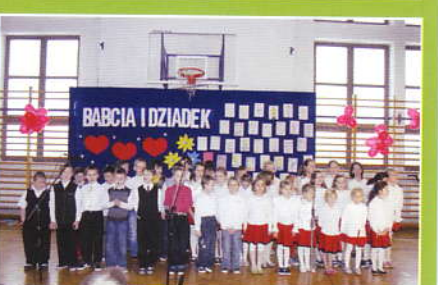
Dzień Babci i Dziadka w Szkole w Zembrzycach