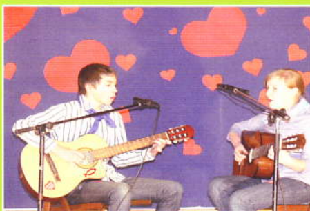
Final Wielkiej Orkiestry w Zembrzycach