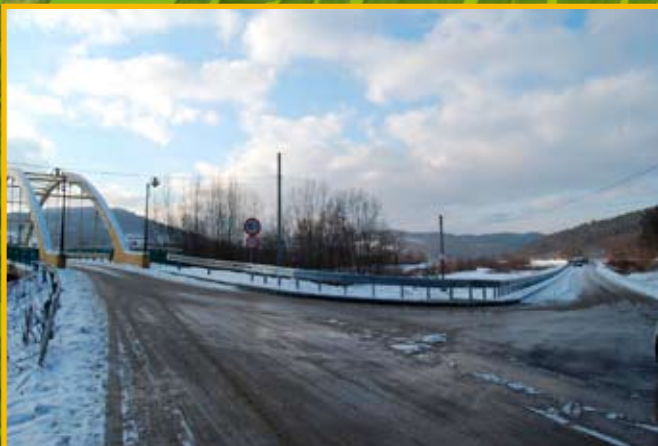
Nowa droga w Zembrzycach