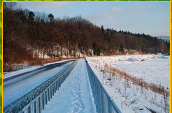
Nowa droga w Zembrzycach