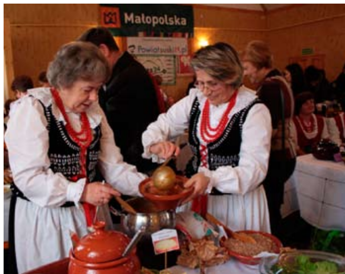
Przedstawicielki KGW „Marcowianki” na konkursie w Stryszawie

Tematem głównym Tegorocznego XII Powiatowego Konkursu o Złotą Warzechę, który odbył się 10 listopada w Stryszawie, była kasza i wariacje na jej temat w potrawach współczesnych i tradycyjnych.