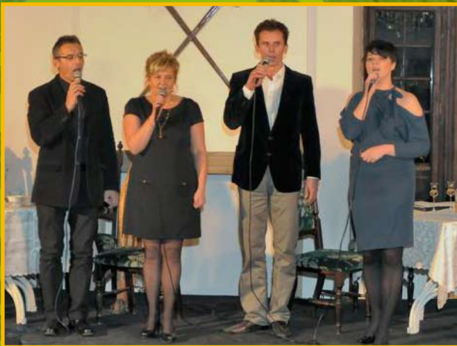
Koncert grupy "Pokolenie" poświęcony Agnieszce Osieckiej