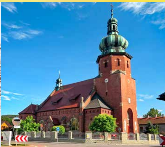
Kościół parafialny dzisiaj