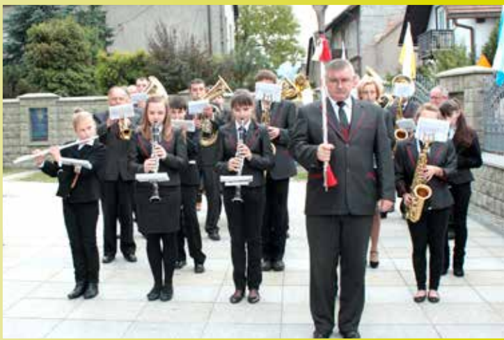
Orkiestra Dęta "Rytm" Zembrzyce na uroczystościach 100-lecia kościoła w Zembrzycach