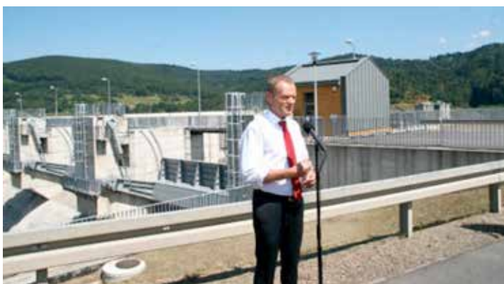
Premier Donald Tusk podczas spotkania na terenie zapory Świnna Poręba