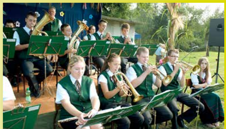
Śleszowickie 1. Stowarzyszenie Muzyczne podczas tegorocznych Dożynek Gminnych w Tarnawie Górnej.