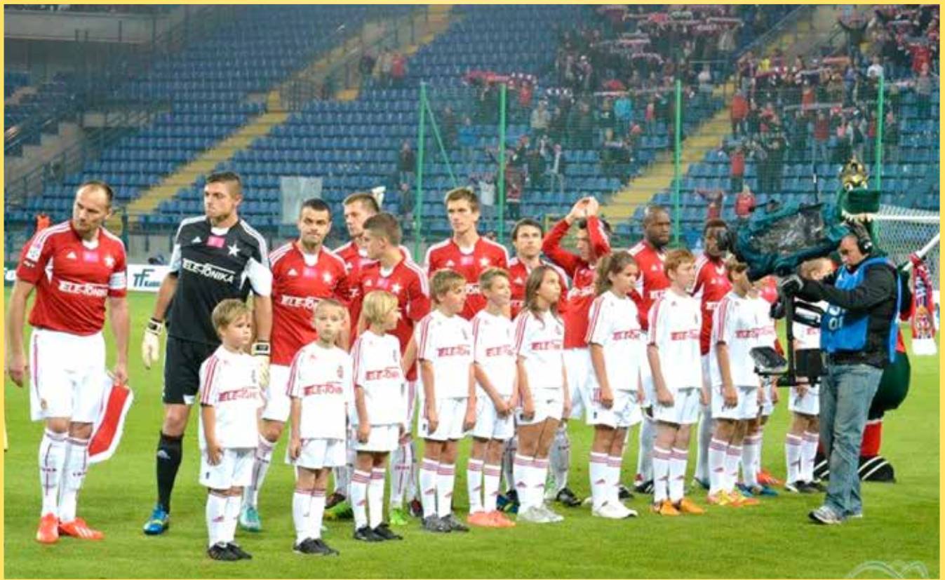
Młodzi Zawodnicy LKS Garbarz Zembrzyce eskortujący piłkarzy Wisły Kraków podczas meczu 9 kolejki T-Mobile Ekstraklasy z Lechią Gdańsk 24 września 2013 r.