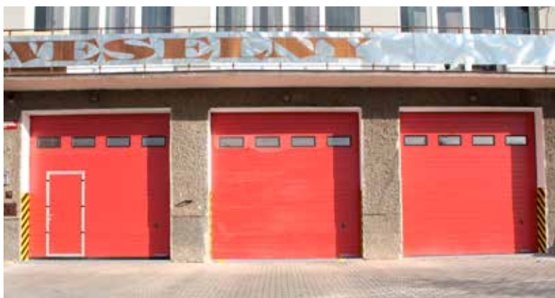
Remiza OSP Zembrzyce po remoncie