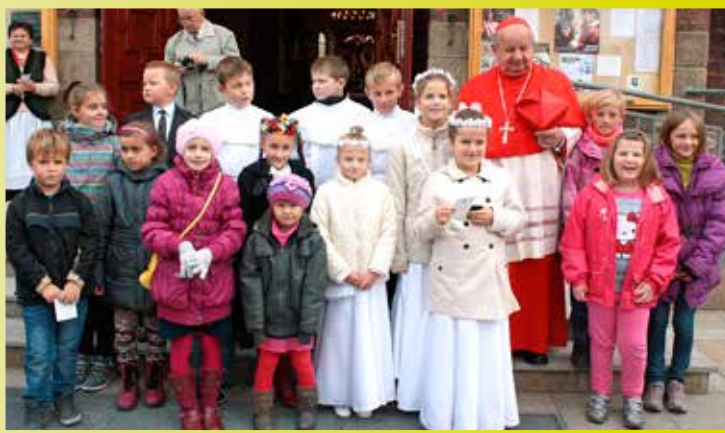
Pamiątkowe zdjęcie z Księdzem Kardynałem Stanisławem Dziwiszem podczas uroczystości 100-lecia murowanego kościoła w Zembrzycach.