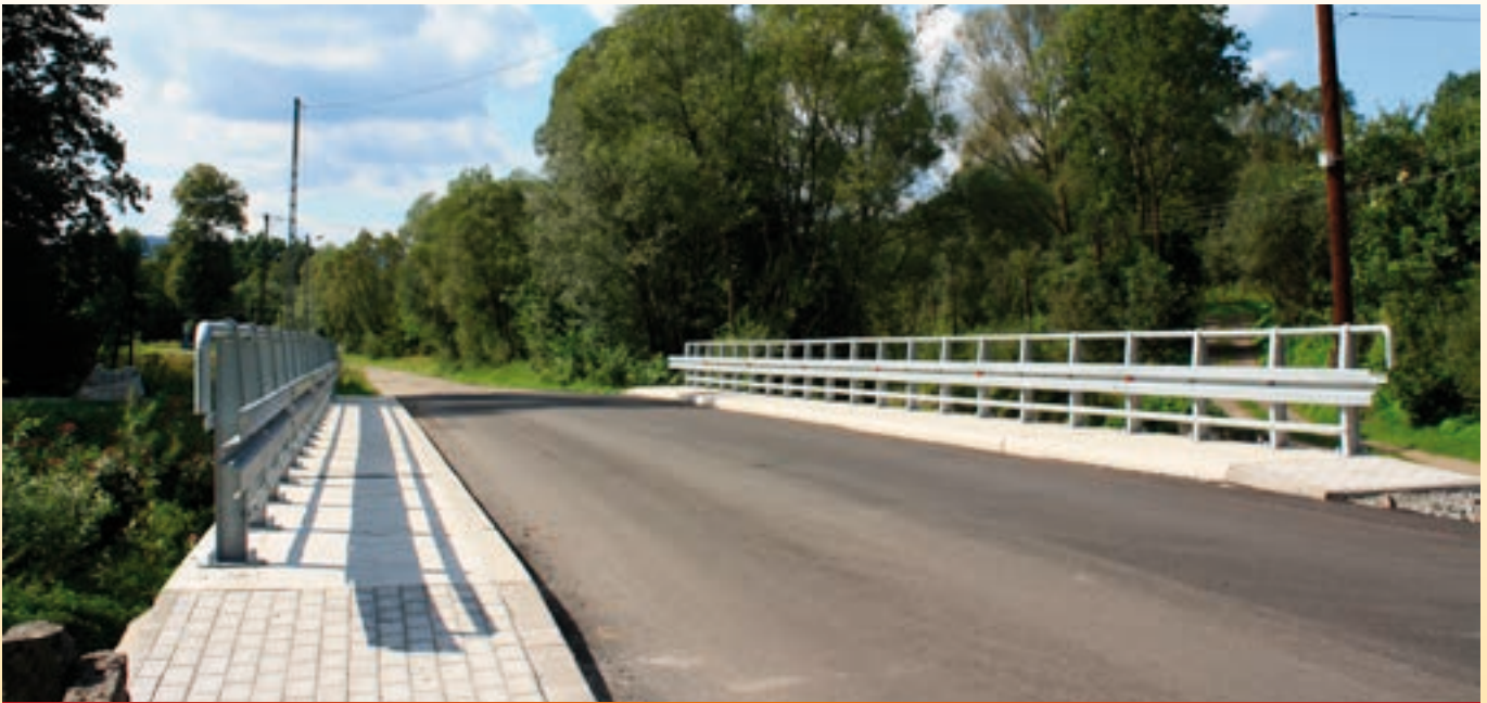
Modernizacja drogi w Tarnawie Dolnej