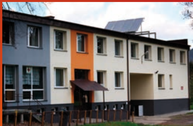
Termomodernizacja budynku Pawilonu sportowego w Zembrzycach