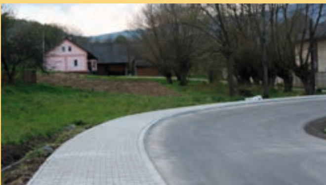
Chodnik w Śleszowicach