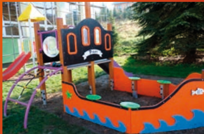
Plac zabaw w Marówec