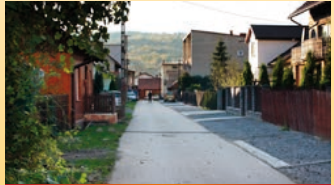
Ulica tzw. „Słowackiego” w Zembrzycach