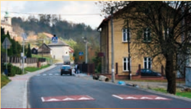
Modernizacja drogi w Tarnawie Dolnej