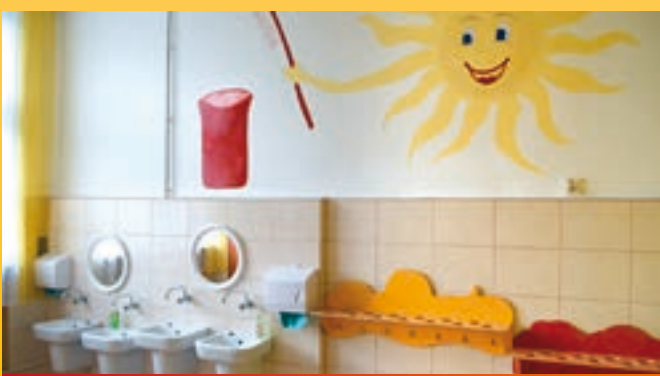
Doposażenie oddziałów zerowych