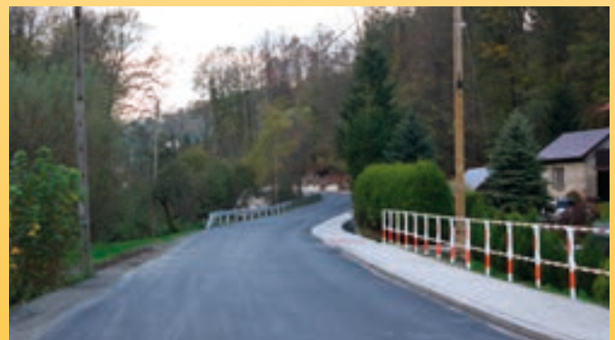
Remont drogi w Tarnawie Dolnej