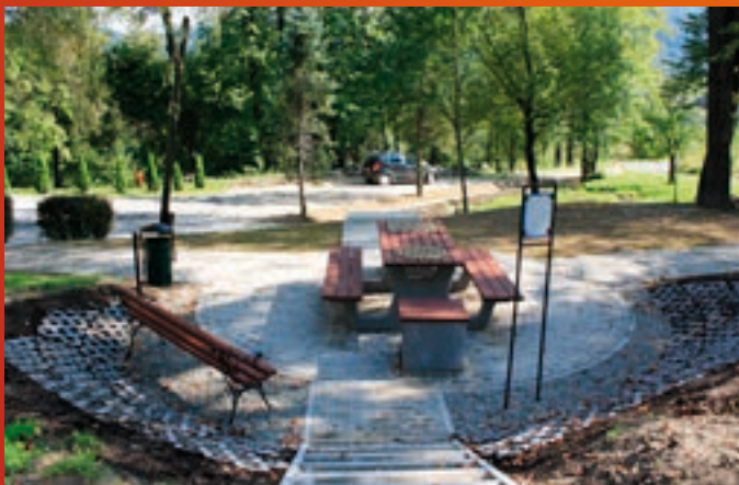
Teren rekreacyjny w Śleszowicach