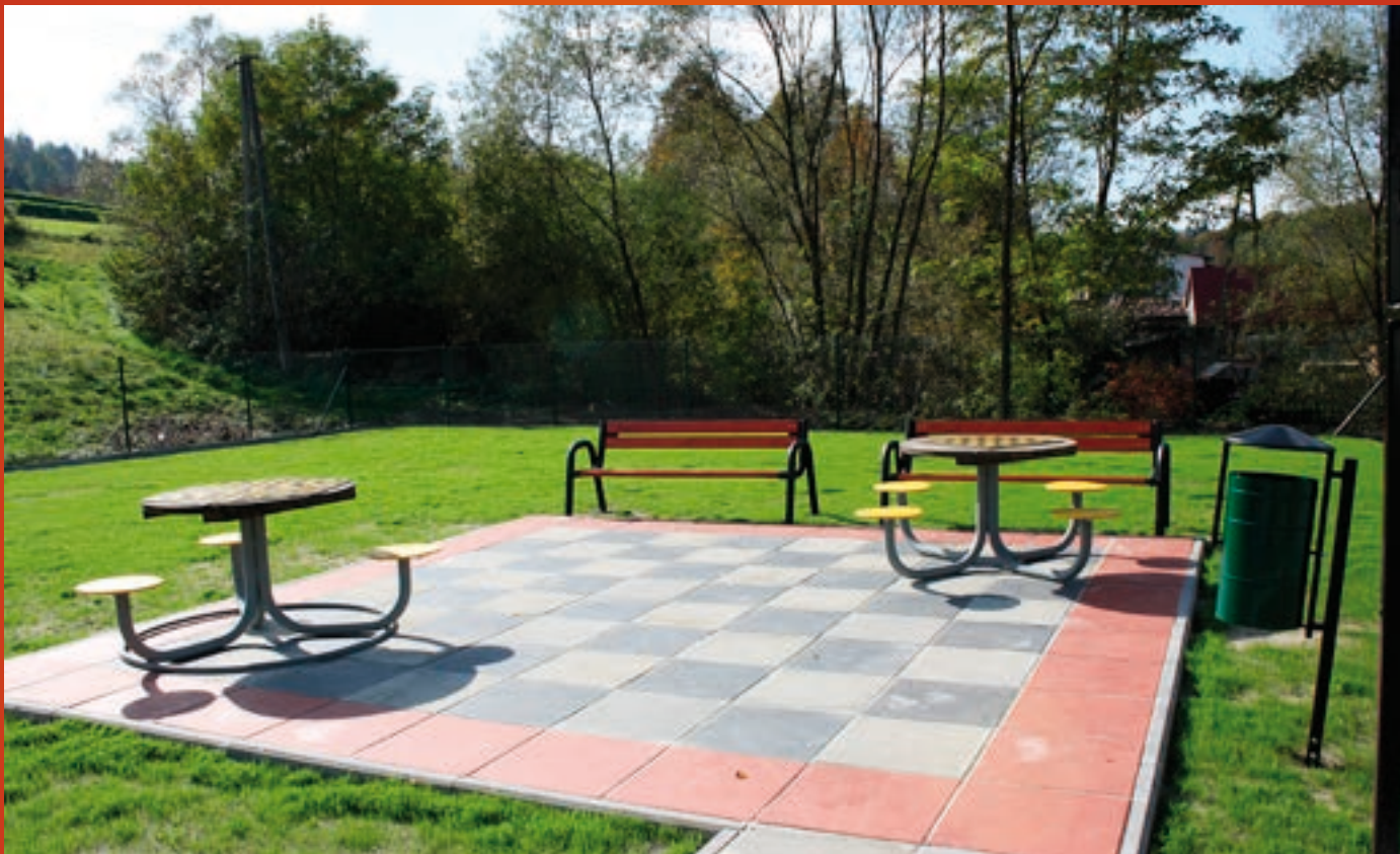
Teren rekreacyjny w Marówec