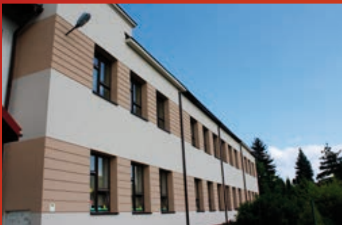
Odnowiony budynek ZS w Zembrzycach