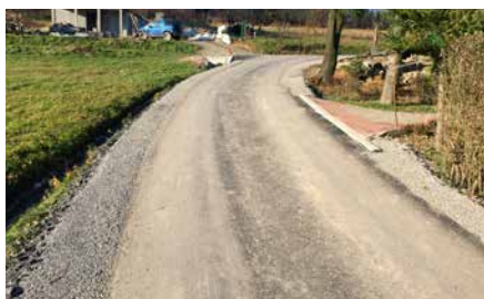
Koźle Tarnawskie Tarnawa Dolna