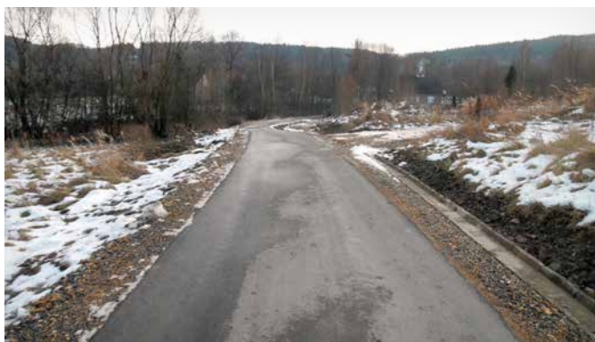
Żmije Tarnawa Dolna