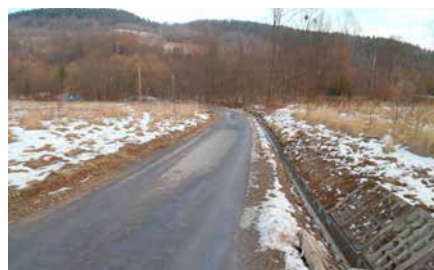
Kapłony Tarnawa Dolna