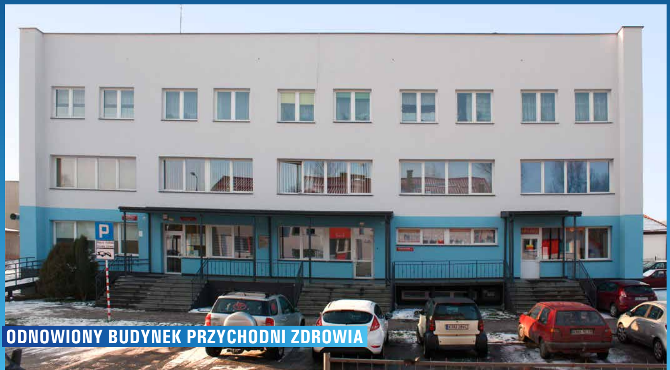
ODNOWIONY BUDYNEK PRZYCHODNI ZDROWIA