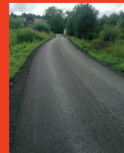
Droga „Do Wróbla” w Zembrzycach