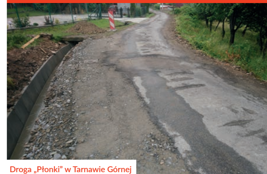
Droga „Płonki” w Tarnawie Górnej