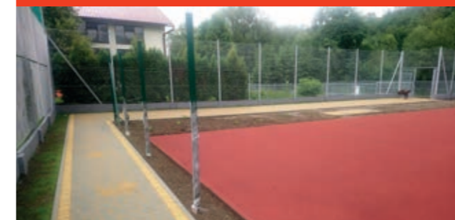
Strefa rekreacyjna w Tarnawie Dolnej