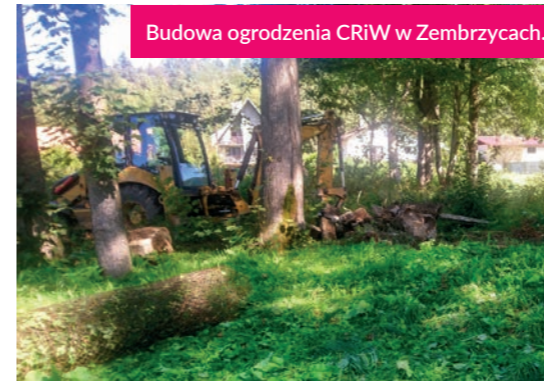
Budowa ogrodzenia CRIW w Zembrzycach.