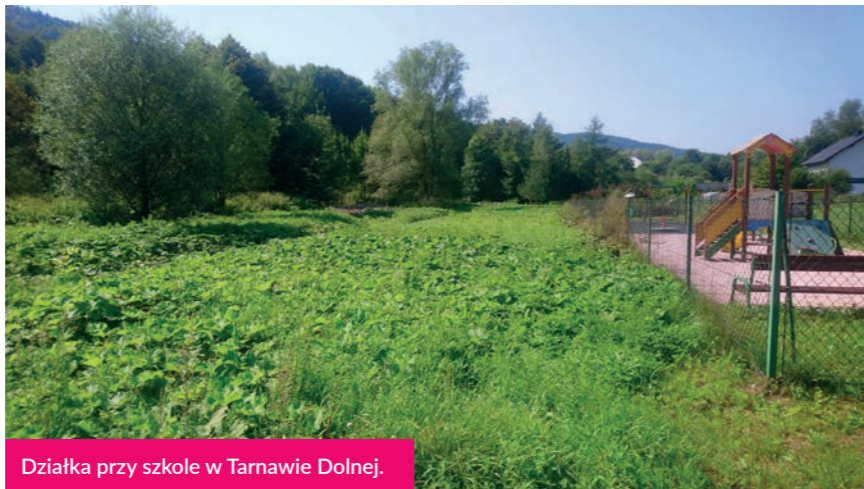
Działka przy szkole w Tarnawie Dolnej.