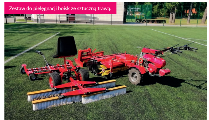
Zestaw do pielęgnacji boisk ze sztuczną trawą.